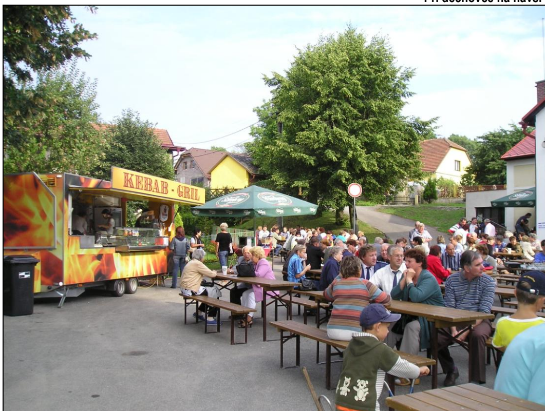
Při dechovce na návsi

V úterý 5.9.2006 byla 10.00 hod. nahlášena návštěva celostátní hodnotící komise, jejímž úkolem bylo ze 13 vítězných vesnic v krajských kolech vybrat vesnici roku 2006 v České republice. Příjezd komise před obecním úřadem a hasičskou zbrojnicí očekávalo celé zastupitelstvo, zástupci jednotlivých spolků, učitelky s dětmi základní školy a také občané. Po spatření mikrobusu v zatáčce u rybníka všichni čekali jeho zastavení, ale ten pokračoval v jízdě směrem k zámku s mávajícím členy komise. Asi po 5 minu-