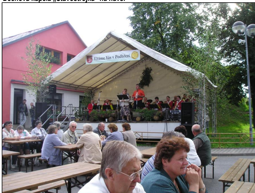
Dechová kapela „Stavostrojka“ na návsi

Hosté se nechali společně s pohádkovými bytostmi vyfotit a vyrazili směr návěs. Předtím však ještě navštívili hasičskou výstavu ve zbrojnici, kde skalečtí i lhotečtí hasiči předvedli ve fotografiích i na videu průřez svojí činností nejen hasičskou, ale i kulturní. Už v hasičské zbrojnici bylo slyšet z návěs vyhrávající dechovou hudbu Stavostrojku z Nového Města n. Metují, která i za občasného popěvku lidí z publika