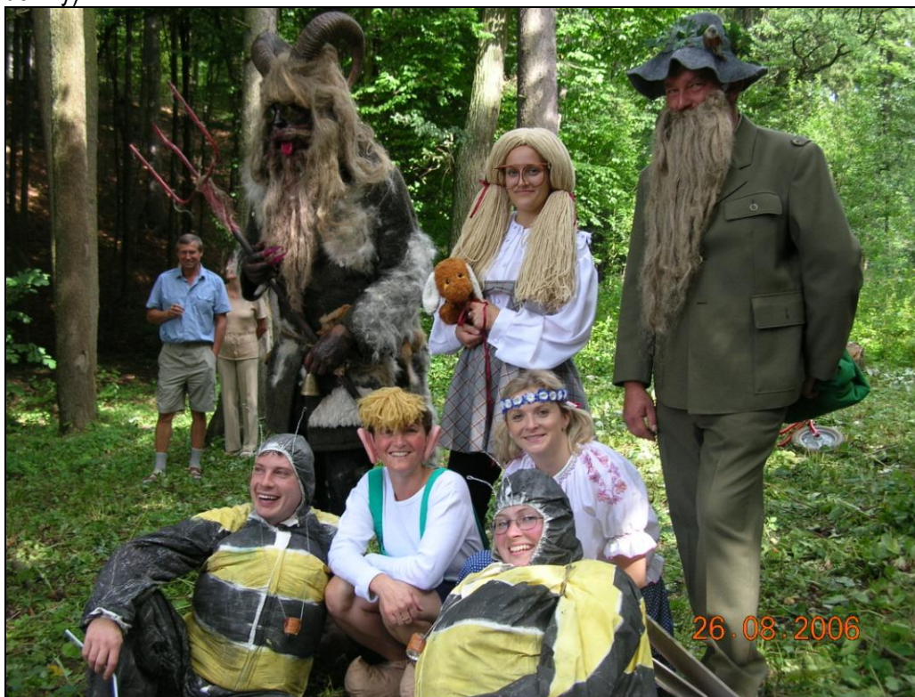
Pohádkové bytosti na židovském hřbitově

končila u splavu, kde se váleli dva velcí líní čmeláci Čmelda a Brunda nasávající pravou Škutinskou medovinu. Pro příchozí již byla medovina také připravena na opěrné zdi splavu v odlivkách a čmeláci vybízeli k napití s tím, že se musí obsloužit sami, neboť jim už nožičky neslouží. Sdružení žen těmito pohádkovými postavami ukázalo všem, jak baví děti na jimi pořádaných akcích (na nich ovšem bez medoviny).