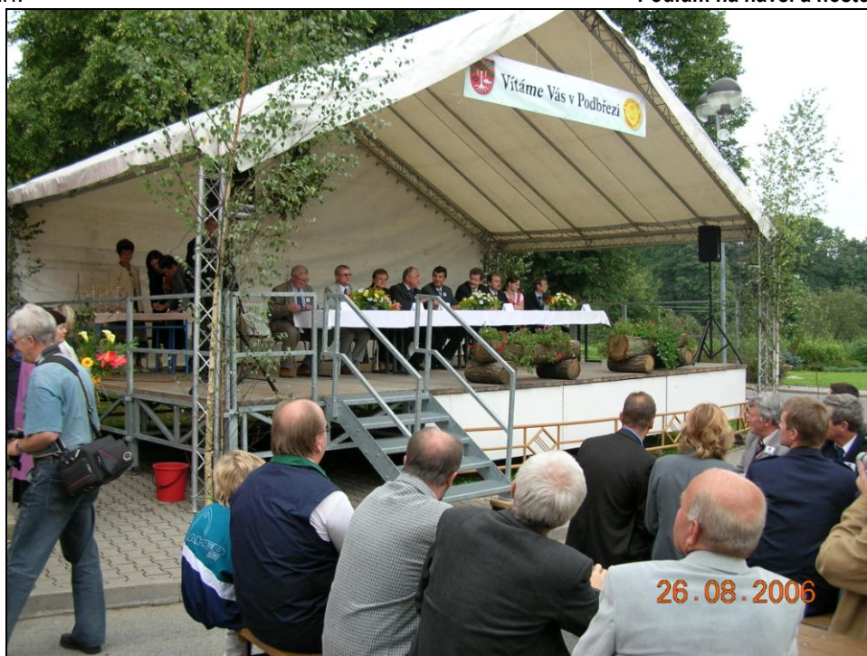
Podium na návsi a hosté

Slavnostní vyhlášení výsledků za Královéhradecký kraj probíhá vždy ve vítězné obci a proto 26.8. proběhlo i zde. Vyhlášení předcházela příprava programu celé akce, kdy se od poloviny července 1x týdně scházelo zastupitelstvo spolu se zástupci jednotlivých spolků (myšlivci, ženy, sportovci, turisté, hasiči). Někteří obyvatelé upravili vzhled okolí svých domků. Obec nechala vyrobit dva nápisy „Vesnice roku 2006 královéhradeckého kraje“, jeden umístila na konstrukci u vjezdu do obce z hlavní silnice I/14 pod tabuli se znakem obce a druhý na dřevěnou desku vedle vchodu na obecní úřad. Také obě autobusové zastávky v Podbřezí u silnice I/14 ozdobily dvě nové plastové tabulky s názvem obce. Dva dny před akcí bylo vystavěno na trávníku před místním obchodem zastřešené pódium, zapůjčené městy Opočnem a Dobruškou. Oslava byla zahájena již v pátek slavnostní děkovnou mší v zámecké kapli, kterou celebroid msn. Socha z Hradce Králové za početné účasti věřících i občanů. Členové místních hasičů v sobotu ráno v den oslav rozmístili na návsi před hospodou skládací lavičky se stoly a na střešní konstrukci pódia pověsili obcí zajištěný nápis „Vítáme Vás v Podbřezí“. Dále připravili na pódium stoly, židle, obecní zvukovou aparaturu a místní truhlář pan Bohuslav Cvejn vše vyzdobil čerstvými zelenými břízkami. Na návsi umístil pojezdový gril nájemce hostince. Vše se stihlo připravit a tak první hos-