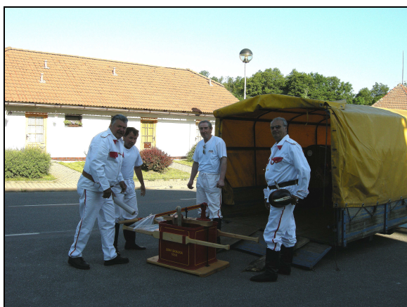
Příprava a odvoz techniky