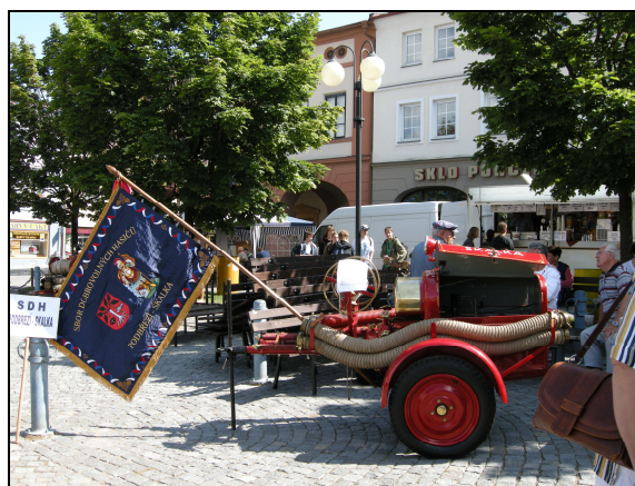
Na náměstí v Dobrušce