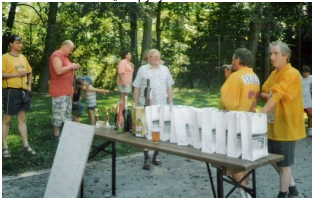
Předávání cen a pohárů