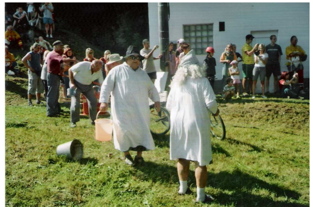
Útok „prahasičů“ – záchrana sousedů v nedbalkách