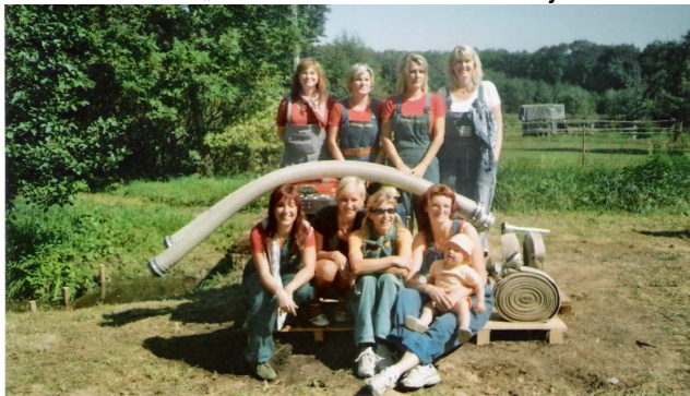
Družstvo žen – „ženy činu“