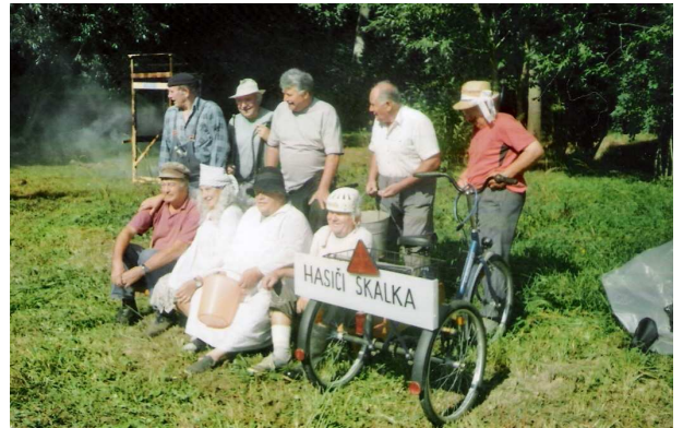
Družstvo veteránů – „prahasiči“