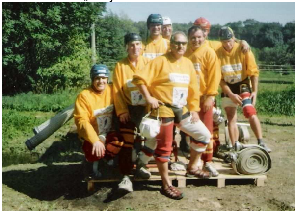
Družstvo mužů 1 – „šuspyci“