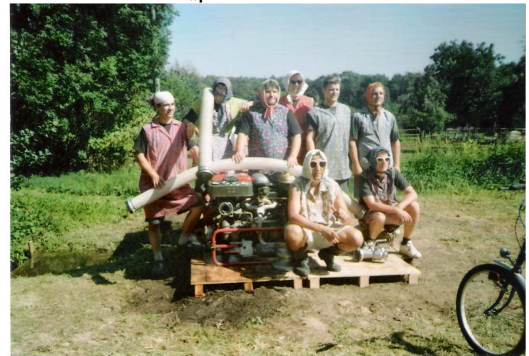
Družstvo mužů 2 – „JZD Skalka“