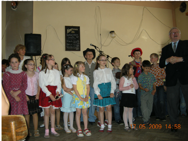
DĚTI A STAROSTA OBCE