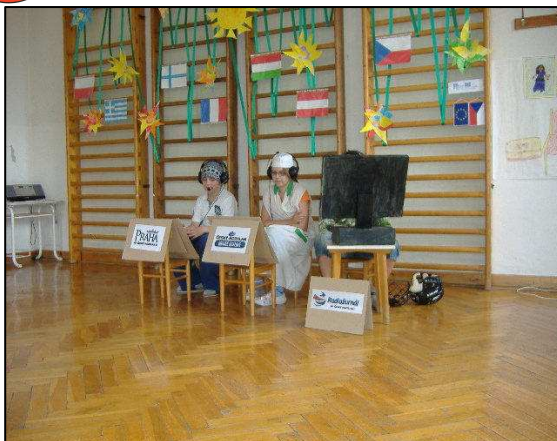
Přehlídka divadel všech partnerských škol v Bílém Újezdu