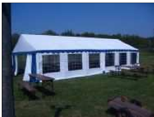
Nový stan, na který obec přispěla 16 tis.Kč (cena 21 tis.Kč)

Tradičně 30. dubna pořádá SDH Lhota Netřeba pálení čarodějnic. Ne jinak tomu bylo i letos, ale s malým rozdílem. Ženy z Podbřezí připravily pro děti překrásné putování lesem s pohádkovými postavami, které svou živelností a přesvědčivým zjevem budily u dětí zasloužený respekt.