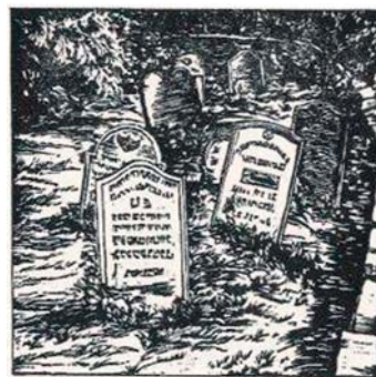
Židovský hřbitov. Dřevoryt J. Michla

Vozovou cestou proti proudu Zlatého potoka, asi 600 m od mostu, dojdeme na židovský hřbitůvek. Měří jen 7 arů a je majetkem židovské obce v Dobrušce. Nejstarší pomníky jsou na malé vyvýšenině při severní zdi blízko brány. Tají se pod klenbou habrů, oběhnány opukovou zdí nad šumícím splavem Zlatého potoka. Pomníky s tajemnými nápisy, polorozpadlé a skloněné, upomínají na zdejší ghetto. Je tu smutno a šero jako bývalo tenkrát, před dvěma sty lety, když se v těch opuštěných místech scházela Machovcova Helenka se záhadným bratrem.