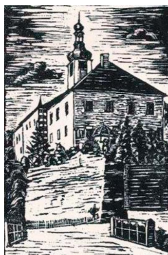
Zámek Skalka u Dobrušky. Dřevoryt J. Michla

Až si přečtete „Temno“ od Aloise Jiráska, jistě zatoužíte shlédnout dějiště tohoto slavného románu – tichou, milou Skalku. Pěkná silnice vás zavede z Dobrušky na Cháboř. Nalevo od silnice, „Na hradišti“, uvidíte dosud znatelný příkop okolo prastaré tvrze. Dále vás vede cesta okolo Melicharovy hospody, kde se dříve říkalo „Na doškovině“, lesíkem Bažantnicí k záhybu Zlatého potoka. Odtud se rozvírá k jihu neširoké údolíčko, ukončené skaleckým zámekem. Uvidíte-li tento koutek při západním slunci, věřím, že na něj nezapomenete. Než k němu do-