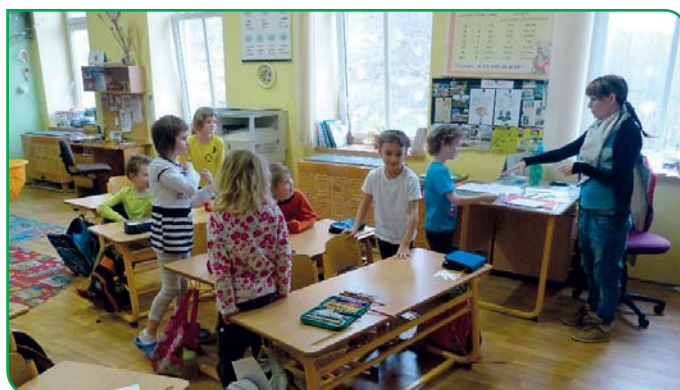
Foto z projektu prevence sociálně patologických jevů