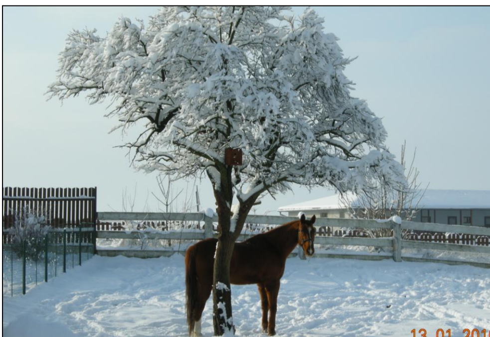
Podbřezí - zima 2010