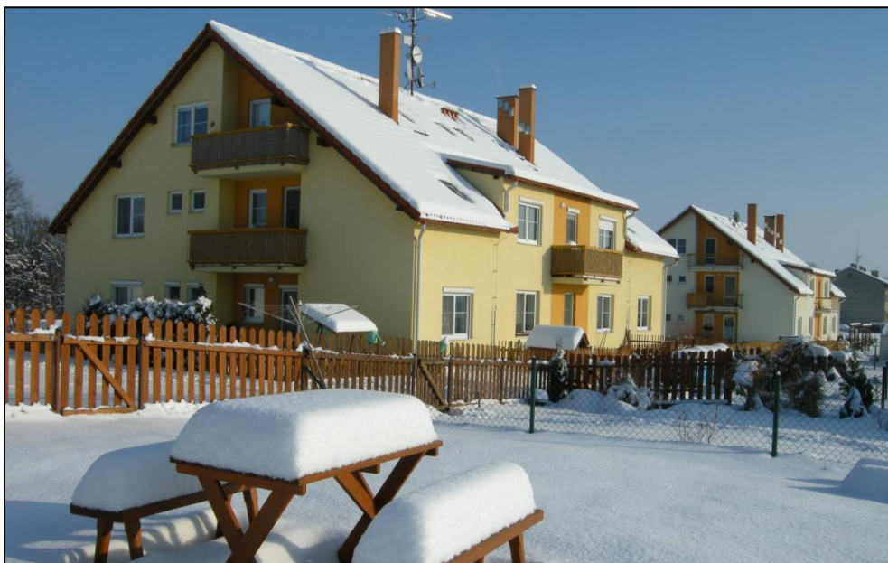
Bytové domy Podbřezí – zima 2009