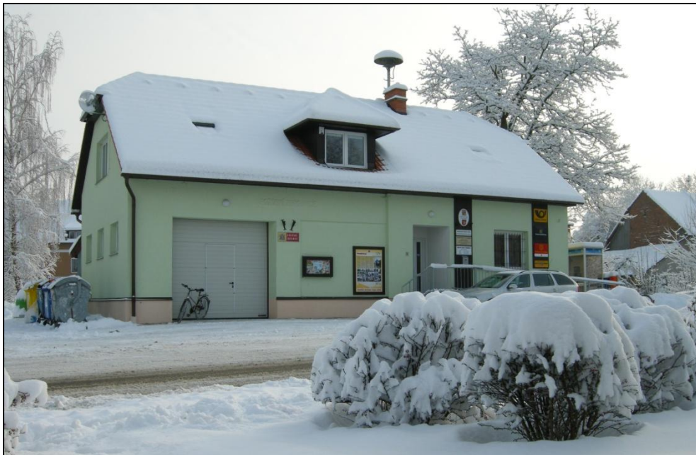
Obecní úřad v Podbřezí - zima 2010