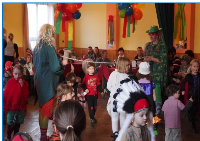
Za Sdružení žen Ester Horáková