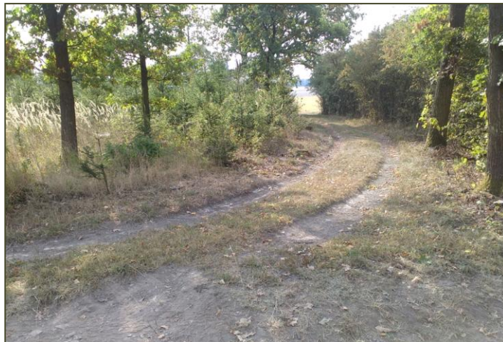
Příjezdová cesta k myslivecké chatě

Od podzimu začíná zimní přikrmování zvěře, aby si zvěř vytvořila dostatečné tukové zásoby před nadcházející zimou. Jaká bude, nikdo neví. Připravit se na ni však musíme.