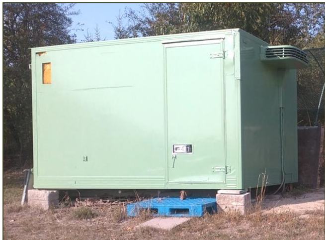
Nová nástavba - technický skládek

je údržba obecních cest, které zároveň slouží zvěři jako myslivecká políčka. Každoročně se musí vyžínat příkopy a prořezat větve stromů podél cest. V letošním roce a na jaro příštího roku jsme si dali za úkol komplexní rekultivaci povrchu cest, posečení pomocí mechanizace mulčováním, rozvláčením a jarním dosevem travní směsi. Tyto práce plánujeme na druhou půli října, protože doposud je zelená vegetace cest hojně navštěvovaná zvěří a osevy ozimů na polích zatím potravní nabídku nenabízí.