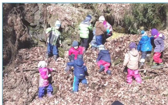
Rozhovor zpracovala Naďa Kasperová