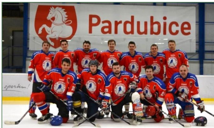
SK Skalka – ČR neslyšící 13:3

V sobotu 22. 1. 2022 naši hokejisté sehráli již druhé přátelské utkání proti české reprezentaci neslyšících. Utkání se stejně jako na podzim sehrálo v tréninkové hale v Pardubicích. Začátek utkání byl snímán kamerami České televize, ale rozebrání utkání v Buly hokej jsem ještě neviděl, tak snad se dočkáme. Začátek zápasu nám nevyšel a brzy jsme prohrávali 2:0. Jakmile odjela Česká televize, spadla z nás nervozita, převzali jsme kontrolu nad utkáním a postupně navýšovali své vedení.