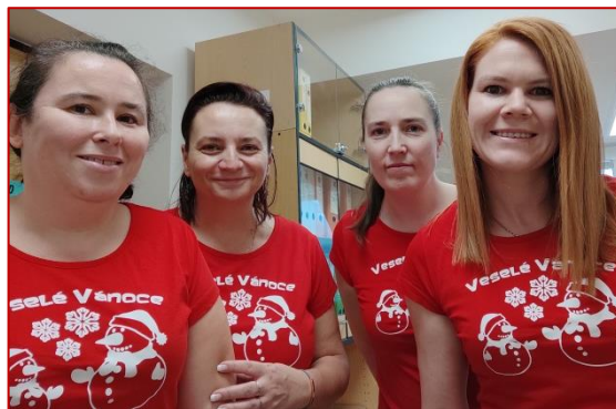
Děvčata z obecního úřadu