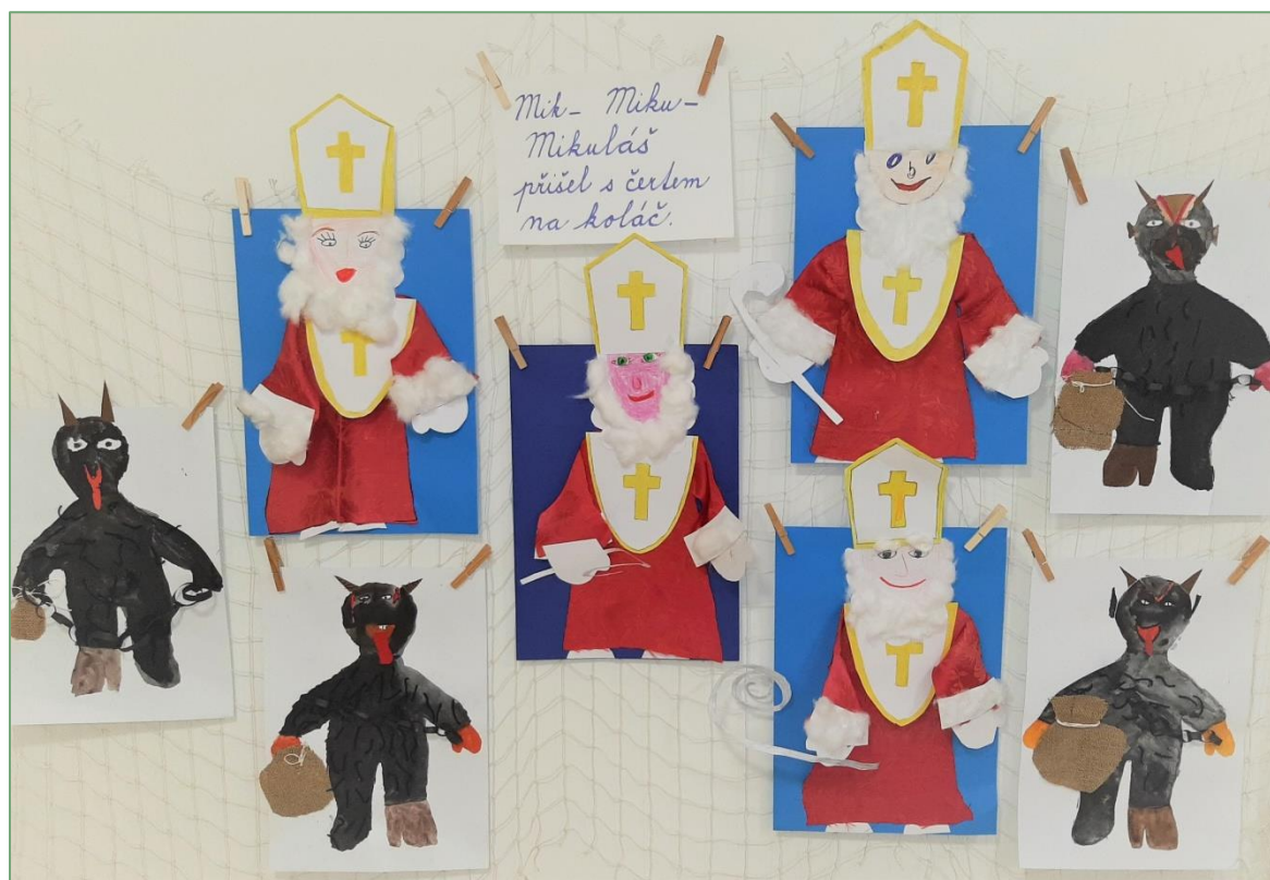
Umělecká tvorba žáků 2. a 3. ročníku.