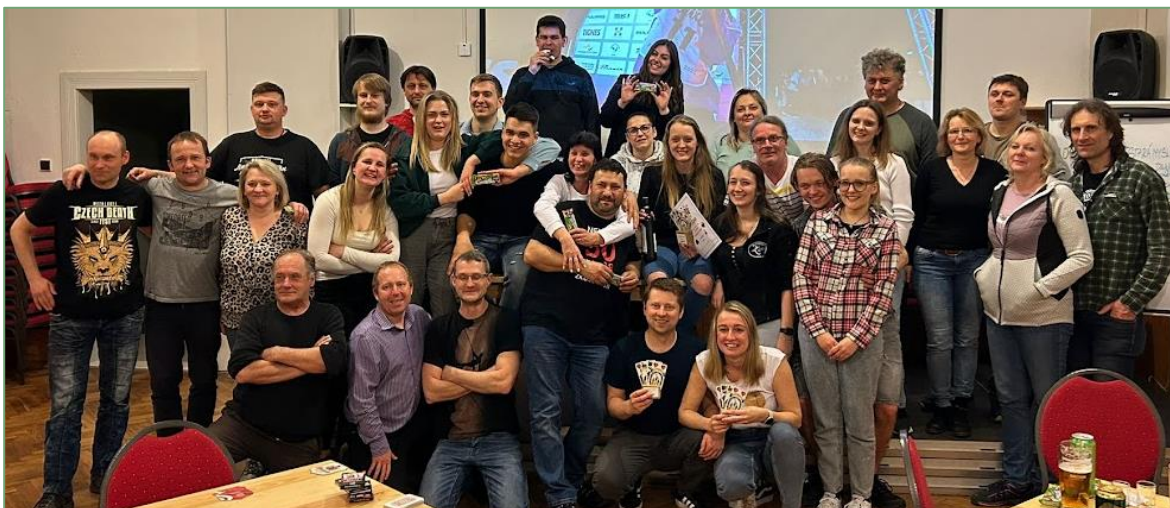
Hráči prvního ročníku v prší 😊