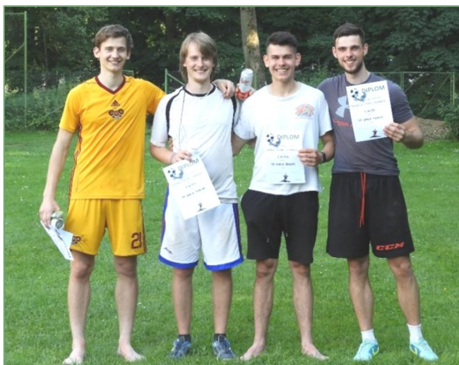
Vítězný tým SK Dukla Skalka

dokonale vrátil porážku ze základní skupiny od týmu Miloše Votroubka a postoupil do finále. Ve druhém semifinále se utkal tým TECHNYCI a TTŽ a po těsném výsledku 1:0 se druhým semifinalistou stal tým pod vedením Jirky Hovorky. V zápase o třetí místo se utkal tým JAK JE DOBRÉ MÍTI MILOŠE a TTŽ a Miloš Votroubek naprosto potvrdil název svého týmu a jediným gólem v tomto zápase rozhodl o bronzovém místě pro svůj tým. Do finálového zápasu, za zvuku hymny Ligy mistrů 😊, proti sobě nastoupily týmy SK DUKLA SKALKKA a TECHNYCI. Finále bylo velmi vyrovnané a po výsledku 2:2 se muselo prodlužovat. V prodloužení se oba týmy shodně prosadily každý po jednom gólu a po celkovém výsledku 3:3 musely finále rozhodnout až penalty. V těch byl úspěšnější tým SK DUKLA SKALKKA, a tak se mohl radovat z celkového vítězství v turnaji a pozvednout nad hlavu putovní pohár. Nejlepšími střelci turnaje se stali Miloš Votroubek a Vláďa Mičian, kteří shodně zaznamenali 4 trefy.