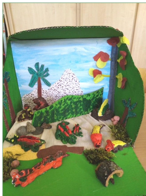
Soutěžní práce dětí ŠD