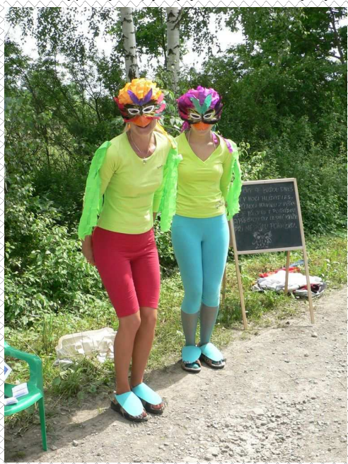
Papoušci z dětského dne (škoda - černobíle není vidět pestrost převleku).

29. - 31. 5. 2010 - společný pobyt našich a solnických turistů v Krkonoších (Labská bouda, Zlaté návrší, Dvoračky) - výšlapy byly ale omezeny vydatným deštěm.