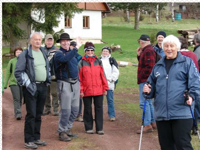
Turisté v Hronově a okolí