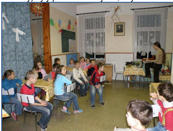
Jídlna-družina před rekonstrukcí

všech řemeslníků a potom i zaměstnanců školy mohl však být školní rok zahájen včas a důstojně. Díky finančním prostředkům EU bylo možno obměnit i některé věci ve třídách. V obou třídách byly vyměněny tabule, v II. třídě funguje tabule jako interaktivní. Byly vyměněny počítače, všechny stávající (zakoupené před dvěma lety) byly přeinstalovány tak, aby se žáci učili s tím nejdokonalejším, co je dostupné.