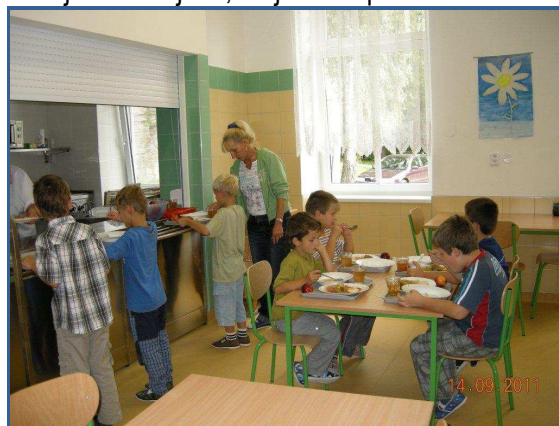
Zcela nová jídelna

Pro všechny, kteří by se chtěli do nové školy podívat, připravujeme na úterý 18. října 2011 den otevřených dveří . Zájemci se mohou v době od 8,30 do 10,30 hod. přijít podívat do tříd na vyučování, odpoledne od 14 do 15 hod. si mohou přijít prohlédnout i nově rekonstruované prostory. Od 15,30 hod. bude ve II. třídě připravena prezentace a první seznámení s Montessori pedagogikou, která bude aplikována v naší nové mateřské škole.