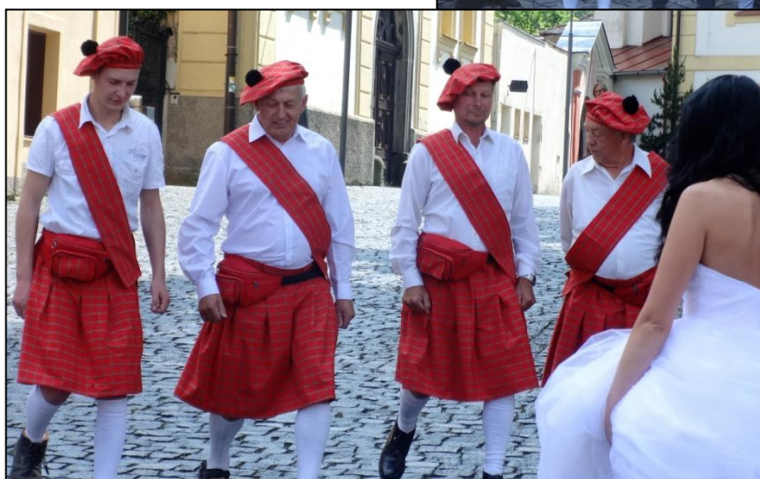
Skotský tanec pro nevěstu

A co nás čeká v létě? Tak hlavně doufáme v trochu stabilnější počasí. Ty soboty jsou letos tak nějak studené a deštivé, takže bychom se rádi drželi zavedené tradice scházet se první pátek v měsíci.