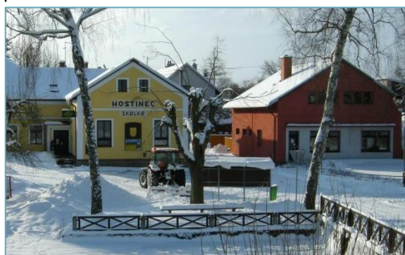
Fotografie z roku 2009

Jsem moc ráda a děkuji Vám, že i tady u nás jste se zapojili, protože potřebných je dost a proto každý dobrý nápad, každá pomocná ruka a každé otevřené srdce je potřebné.